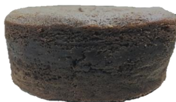
หน้า และ/หรือ ขอบข้างแตกบริเวณขอบ