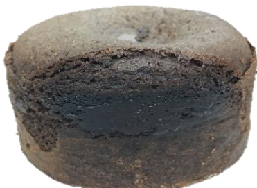
ขอบข้างบาง