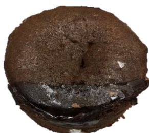
หน้าเลอะจนไม่สามารถแก้ไขได้