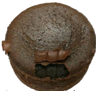
ฟองอากาศขนาดใหญ่และแตก