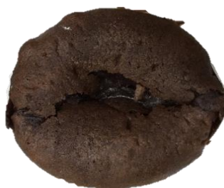
รอยแตกยาวเกิน 3.5 ซม.